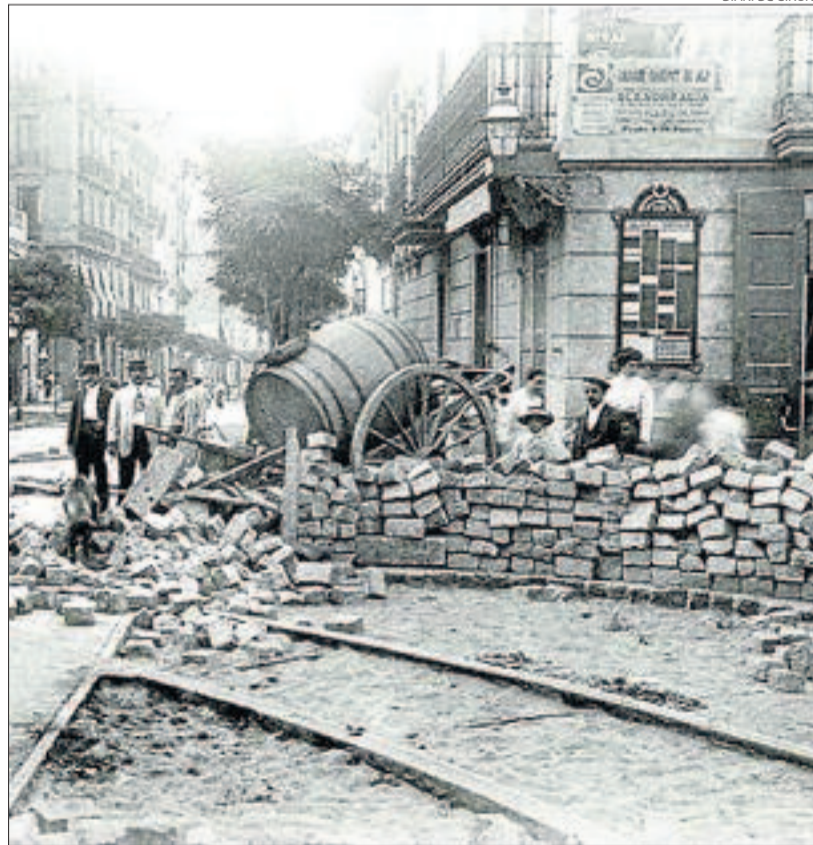
Una imatge icònica de la Barcelona de la Setmana Tràgica de 1909.

Hi ha la violació i l'assassinat d'una nena en un barri obrer, hi trobem el contrapunt dels germans Estrada i la seva fàbrica. L'argument, tot i estar teinyit de l'època històrica, té en comú amb altres ficcions de l'autor la recerca del misteri i la tensió. Hi tenim un capellà, Feliu, que ha vist l'assassinat,