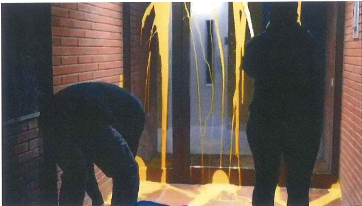
Miembros de Arran lanzando pintura.

Miembros de Arran , organización juvenil vinculada a la CUP, han lanzado pintura amarilla en el domicilio del juez del Tribunal Supremo Pablo Llarena en Sant Cugat del Vallès (Barcelona). La organización ha colgado en Twitter un vídeo de la acción en el que se observa cómo dos jóvenes llegan a