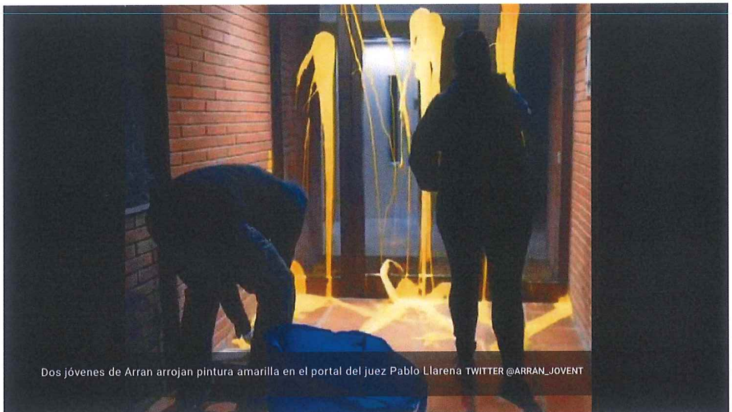
Dos jóvenes de Arran arrojan pintura amarilla en el portal del juez Pablo Llarena

14.11.2018 | actualización 20:52 horas | Por RTVE.es / EFE